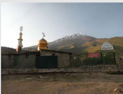
Početak uspona na Damavand-Gofsand Sara(3040m)

Konačno smo na putu ka baznom kampu Gofsand Sara (3040m.), polazne tačke uspona na Damavand. Izabrali smo južnu stranu za uspon koja se najčešće koristi zbog velikog smeštajnog kapaciteta doma Bargah Shelter (4200m.). Na Damavand je moguć uspon i sa zapadne strane preko planinarskog doma Simogh Shelter (4200m.) ili istočne od doma Takht e feridon Shelter (4380m.).