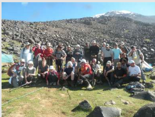
Konačno svi na okupu

Još se čestito i ne odmorismo a već moramo šatore i velike rančeve da pripremimo za transport. Popodne se vraćamo u bazni kamp i ponovo postavljamo šatore, sada to ide i brže i bolje. I treću noć prespavismo u šatorima. Priviknuti na visinu, brzo ih pakujemo i krećemo do naših kombi vozila.