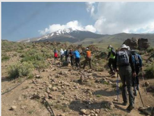
Prvi dan uspona

sa blagim usponom. Dolazimo do rascvetalog polja maka i biramo najbolje uglove za fotografisanje.