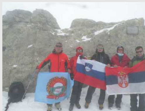
Zastave na Damavandu

Gledali smo fotografije snimljene sa vrha planine na kojima nema ni trunke snega. Uspon je konstantnog nagiba a sa visinom se povećavala visina snega. Još dvoje planinara odustaju na visini od 4900m. Ušli smo u maglu i dubok sneg. Pratimo probijenu stazu vodiča i naših najspremnijih planinara. Na 5200m. se pojavljuju prva sumporna isparenja. Lako prepoznamo jer ta mesta nisu pod snegom. Problem nastaje kad vetar duva sa tih površina ka našoj koloni. Kad se to desi zastajkujemo i stavljamo natopljene maske sa sirćetom. Brojimo korake a brojka se smanjuje. Pauze su sve češće. Prva grupa se vraća sa vrha hrabri nas i smanjuje vreme do vrha. Prolazno vreme je zadovoljavajuće. Sad smo sigurni da ćemo uspeti. Ulazimo u stenoviti deo i to je kraj. Na samom vrhu se čuje jeziva tutnjava iz utrobe zemlje. Nije baš prijatno. Na vrhu smo izlazili po grupama, fotografisali se i što pre nazad bez zadržavanja.