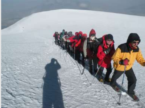
Još malo pa smo na vrhu