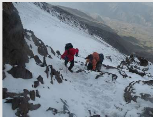
Detalj sa uspona

Gledali smo fotografije snimljene sa vrha planine na kojima nema ni trunke snega. Uspon je konstantnog nagiba a sa visinom se povećavala visina snega. Još dvoje planinara odustaju na visini od 4900m. Ušli smo u maglu i dubok sneg. Pratimo probijenu stazu vodiča i naših najspremnijih planinara. Na 5200m. se pojavljuju prva sumporna isparenja. Lako prepoznamo jer ta mesta nisu pod snegom. Problem nastaje kad vetar duva sa tih površina ka našoj koloni. Kad se to desi zastajkujemo i stavljamo natopljene maske sa sirćetom. Brojimo korake a brojka se smanjuje. Pauze su sve češće. Prva grupa se vraća sa vrha hrabri nas i smanjuje vreme do vrha. Prolazno vreme je zadovoljavajuće. Sad smo sigurni da ćemo uspeti. Ulazimo u stenoviti deo i to je kraj. Na samom vrhu se čuje jeziva tutnjava iz utrobe zemlje. Nije baš prijatno. Na vrhu smo izlazili po grupama, fotografisali se i što pre nazad bez zadržavanja.