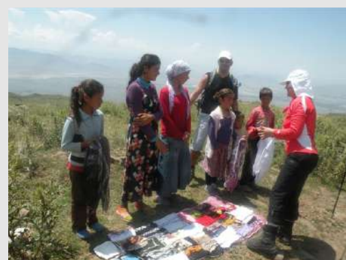
Trgovina pod vedrim nebom

Teške rančeve prenose mule, a mi lagano sa malim rančevima krećemo u koloni. Pogled nam je stalno uperen ka planinskom gorostasu. Za koji dan bićemo na vrhu samo da nas vreme posluži. Usput se odmaramo kraj nomadskih šatora. Za nepuna četiri sata stigli smo u bazni kamp, podižemo šatore i pripremamo se za počinak. Za razliku od ranijih godina kamp ima domaćina koji održava montažne VC-e i higijenu.