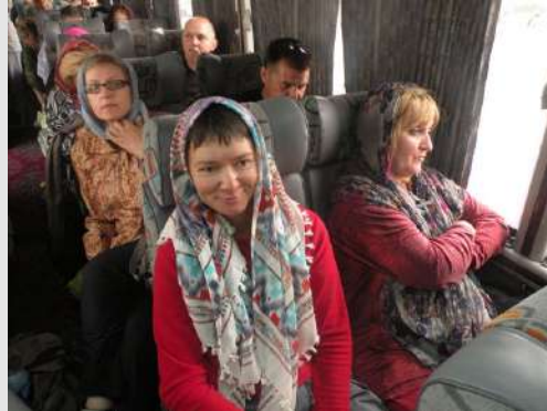
Ušli smo u Iran

Po planu napuštamo Dogubajazit, istočnu kapiju Turske, i dolazimo na tursko-iransku granicu. Naše dame pripremaju marame, koje će od danas pa do povratka u Tursku stalno nositi. Izgledaju nam čudno!