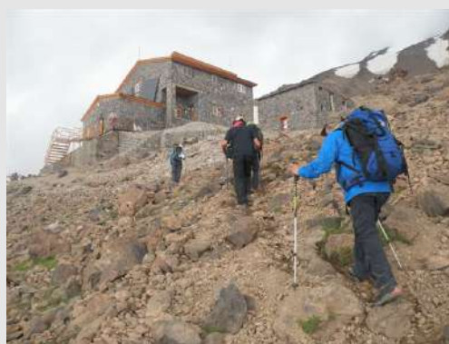
Planinarski dom-Bargah Shelter(4200m)

Od Polura (2250m.) ka baznom kampu vodi asfaltni put koji se završava neravnim makadamom. Vreme sunčano a planina čeka. Nakon jednočasovnog pogađanja oko transporta opreme sa domaćinima, krenuli smo na uspon Staza je neobeležena, dobro vidljiva