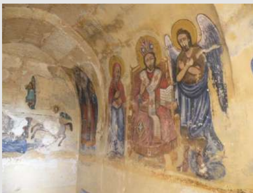
Očuvane freske u crkvi Sv. Vasilija