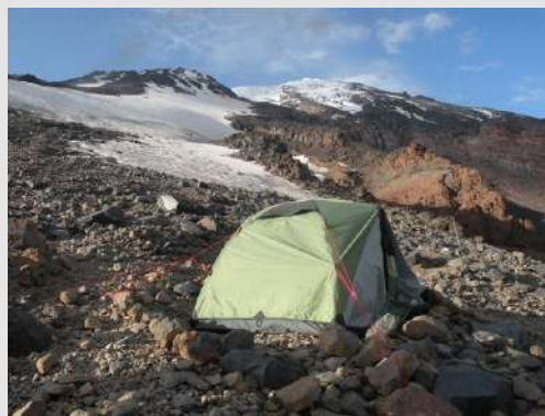
Ledeni kamp-ko me postavi u ovom kršu

Ledeni kamp je dobio ime po hladnoći i snežnim krpama koje nas okružuju. Ponovo podižemo šator na već unapred pripremljenim mestima. Pokreti su nam usporeni i traju. Oni koji to rade brže, brže se i zamore. Rano smo stigli u ledeni kamp i obavili završne pripreme. Stalno gledamo ka vrhu i molimo se da sutra bude lep dan. Po zalasku sunca uvlačimo se u naše vreće, sutra se rano ustaje i po mraku započinje uspon.