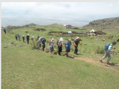
Kolona ka baznom kampu u pozadini nomadski katun

Teške rančeve prenose mule, a mi lagano sa malim rančevima krećemo u koloni. Pogled nam je stalno uperen ka planinskom gorostasu. Za koji dan bićemo na vrhu samo da nas vreme posluži. Usput se odmaramo kraj nomadskih šatora. Za nepuna četiri sata stigli smo u bazni kamp, podižemo šatore i pripremamo se za počinak. Za razliku od ranijih godina kamp ima domaćina koji održava montažne VC-e i higijenu.