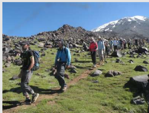
Lakše je nizbrdo

Silazimo drugom stazom, stalno se okrećemo ka vrhu diveći se sami sebi i našem uspehu. U hotelu nas je dočekala druga grupa sa raznim posluženjima. Naveče smo organizovali zajedničku večeru na terasi hotela i proslavili uspon na Ararat.