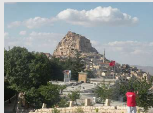
Najviša kula u Kapadohiji