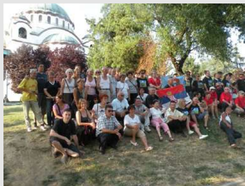
Veliki put Pobjede i na istok i na zapad

Krenuli smo iz Skerličeve ulice praćeni prijateljima, planinarima i "bekerajcima"(sl.1). Nakon uobičajenog fotografisanja pošli smo na izazovno putovanje, koje smo planirali još 2009 godine. Veliki izazov su usponi na dve planine preko 5000m. kao i obilazak nama nepoznatog Irana.