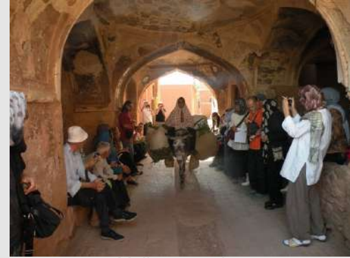
Molim za prolaz

Smeštamo se u strogom centru Isfahana, koji je jedan od najblistavijih gradova Istoka. Videli smo remek dela persijske kulture od 10 do 18 veka: Veliku džamiju, Kraljevski trg, Palatu Ali Kapu, katedralu u jermenskoj četvrti Đolfa, most na reci Zajenderud koja je nažalost presušila pa nismo mogli da u potpunosti doživimo lepotu reke i čuvenog mosta.