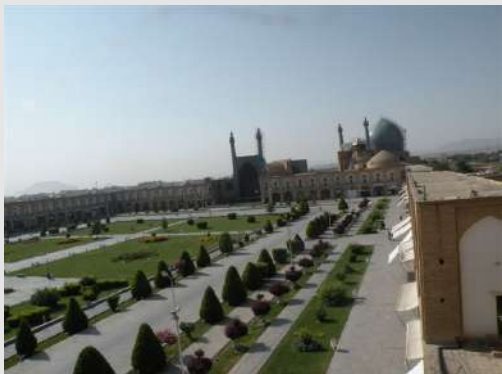
Isvahan-Velika džamija na kraljevskom trgu

Smeštamo se u strogom centru Isfahana, koji je jedan od najblistavijih gradova Istoka. Videli smo remek dela persijske kulture od 10 do 18 veka: Veliku džamiju, Kraljevski trg, Palatu Ali Kapu, katedralu u jermenskoj četvrti Đolfa, most na reci Zajenderud koja je nažalost presušila pa nismo mogli da u potpunosti doživimo lepotu reke i čuvenog mosta.