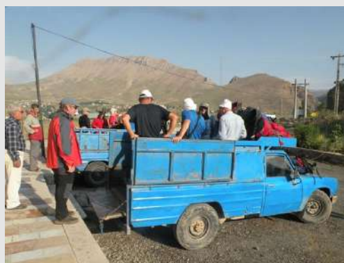
Krećemo ka Damavandu kamionetima iz Polura

Dugo smo putovali kroz Teheran do Polura. Nakon smeštaja u novom planinarskom domu, kojim upravlja Planinarski savez Irana, odlazimo na večeru sa našim vodičem. Odmor nam je neophodan jer nas čekaju novi napori. Od ranog jutra smo na nogama spremni da nastavimo vožnju malim kamionetima koji po običaju kasne. Dok čekamo prevoz regulišemo dozvole za uspon.