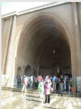
Nacionalni muzej Irana