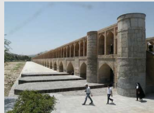
Most na reci Zajenderud

Predveče smo krenuli ka Turskoj i nakon uobičajene procedure na granici i pretovara u naš autobus, stigli u Ahlat na obali Jezera Van. Narednog dana smo predveče krenuli ka Kapadohiji. Biti u Turskoj a nevideti "Muzej pod vedrim nebom" bi bila prava šteta.