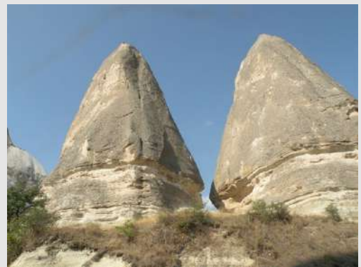
Kapadohija-Muzej pod vedrim nebom

Čudo prirode, a zove se Kapadohija, je nastalo erupcijom vulkana Erdžijas i Hasan-Daga pre deset miliona godina. Sloj lave debljine 150m. prekriva teritoriju od 5 000km 2 . Kasnijom erozijom stene dobijaju čudesne oblike pa cela Kapadohija izgleda kao okamenjeno more. Hiljadama godina je lokalno stanovništvo klesalo u vulkanskim stenama podzemne gradove, kuće, crkve i manastire. Do danas je registrovano 300 crkava, kapela i manastira. Narod Kapadohije je među prvima prihvatio Hristovo učenje. Obišli smo crkvu Svetog Vasilija u Sinasosu kao i geo-morfološke tvorevine popularno nazvane "vilinski dimnjaci".