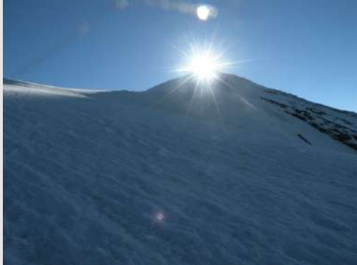
Na vrh se prvo popelo sunce