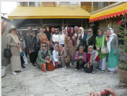
Ženski deo ekipe na Velikom putu Pobede

Unapred smo se naoružali strpljenjem pa nam ne smeta duga procedura na granici. U Iranu nas sačekuje iznajmljeni autobus i ljubazno osoblje. Pred nama je dug put do Teherana sa čestim zadržavanjima na velikim raskrsnicama. U Teheran stižemo posle ponoći u rezervisani hotel gde najčešće odsedaju planinari iz Srbije. Nalazi se u centru grada pa su nam sve interesantne destinacije veoma blizu. Narednog dana smo obišli Nacionalni muzej Irana, a popodne krenuli autobusom ka Poluru, gde smo planirali prenoćište.