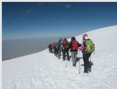
Veselim korakom nazad

Jak vetar i niska temperatura nas poteraše ranije sa vrha. Sačekujemo se u padnožju, gde je bilo prijatnije. Krupnim i veselim koracima se vraćamo u ledeni kamp. Najteže je bilo silaženje između kamenih blokova. Pri usponu nije bilo problema da li zbog mraka ili svežine?