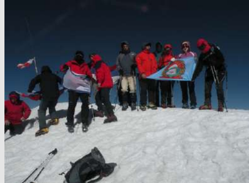
Jedva nekako razvismo državna i klupska obeležja

Jak vetar i niska temperatura nas poteraše ranije sa vrha. Sačekujemo se u padnožju, gde je bilo prijatnije. Krupnim i veselim koracima se vraćamo u ledeni kamp. Najteže je bilo silaženje između kamenih blokova. Pri usponu nije bilo problema da li zbog mraka ili svežine?