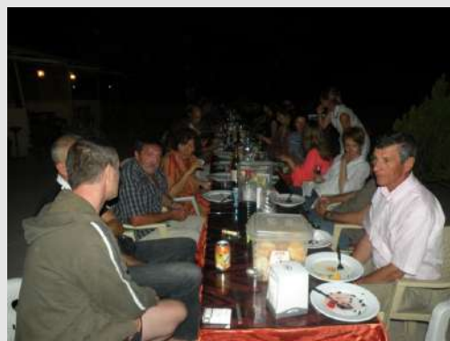
Zajedno proslavljamo uspon na Ararat

Silazimo drugom stazom, stalno se okrećemo ka vrhu diveći se sami sebi i našem uspehu. U hotelu nas je dočekala druga grupa sa raznim posluženjima. Naveče smo organizovali zajedničku večeru na terasi hotela i proslavili uspon na Ararat.