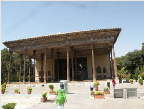
Palata Ali Kapa