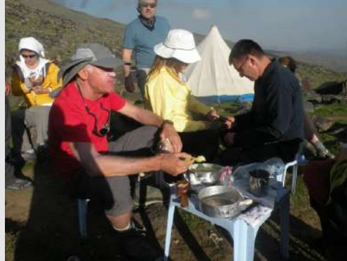
Bazni kamp-redovna zdravstvena kontrola

Prvi deo uspona je uspešno savladan, očekuje nas drugi deo do 4200m. Oksimetrom proveravamo zdravstveno stanje planinara. Rezultati su više nego dobri, raspoloženje je na visokom nivou. Po zalasku sunca uvukla se hladnoća u naše šatore.