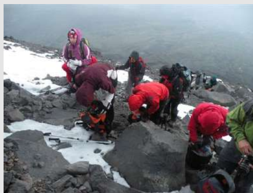
Dalje se nemože bez dereza

Mir i tišina sa zvezdama prosutim po nebu. U podnožju svetla pograničnih sela Turske i Irana. Budimo se i sa nestrpljenjem očekujemo vreme za polazak. Sa baterijskim lampama penjemo se kamenitom stazom. Zora nas je zatekla na prvim zasneženim i zaleđenim stranama. Montiramo dereze i lagano krećemo ka vrhu.