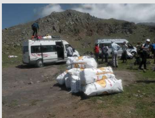
Početak uspona na biblijsku planinu