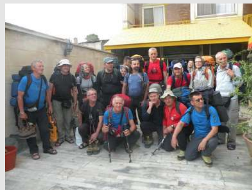
Ekipa je spremna za Damavand

Od Ararata se pruža severni i zapadni venac iranskih planina. Severni se proteže duž azerbejdžanskih planina, Elbursa (provincije Teheran, Gilan i Mazandaran) preko Gardaga (provincija Harasan), Hindukuša do Avganistana i Himalaja. Najviši vrh u masivu Elbursa je Damavand (5671m.) udaljen 80km severoistočno od Teherana. Damavand je najviši vrh Irana i najviši strato vulkan Azije. Na vrhu se nalazi krater širine 150m. sa zamrznutim jezerom prečnika oko 40m. Na pojedinim mestima se osećaju jaka sumporna isparenja koja otežavaju uspon. Za uspon se preporučuju maske natopljene rastvorom razblažene sircetne kiseline. Zapadni venac iranskih planina se prostire od Ararata kroz severozapadni Iran i obuhvata planinski masiv Zargos s najvišim vrhom Zard Kuhe Dahtijar (4309m). Oba ova planinska venca su jako nepristupačna a naseljena su nomadima.