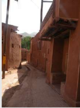
Abijaneh selo pod zaštitom UNESK-a